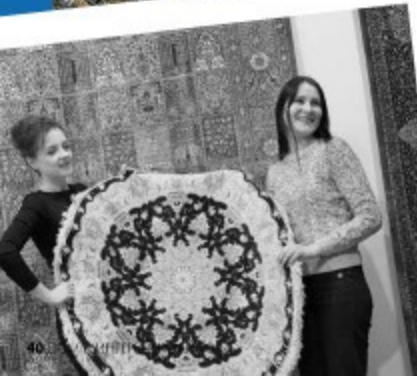
Ковры кластер Амолда