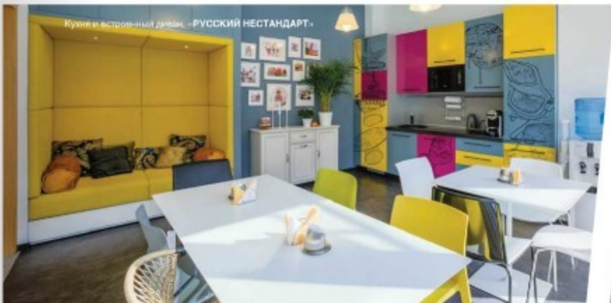
Кухня и встроенный диван, - РУССКИЙ НЕСТАНДАРТ -