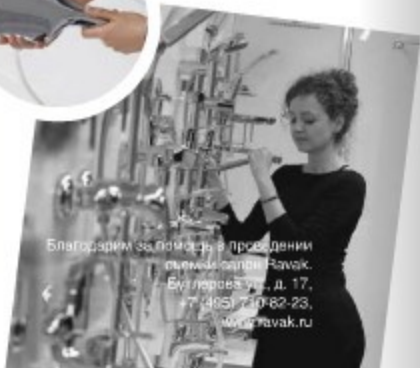
Благодарим за помощь в проведении съемки магазин Ravak. Бульваров ул., д. 17, 7 4851 71082-23, www.ravak.ru