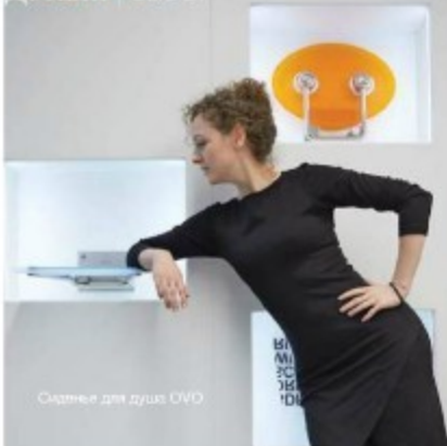
Сиденье для душа OVO