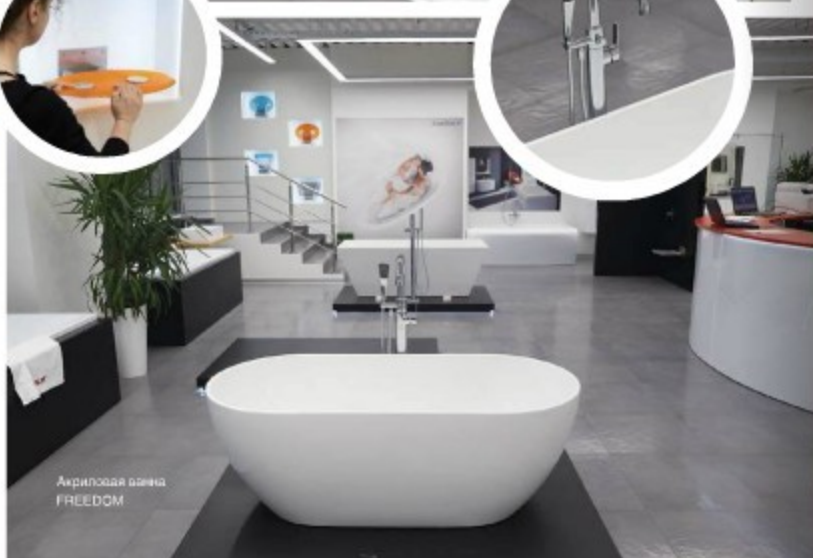
Акриловая ванна FREEDOM