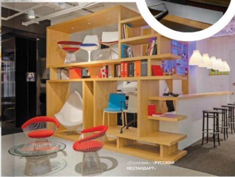
«Стулотека», -РУССКИЙ НЕСТАНДАРТ»