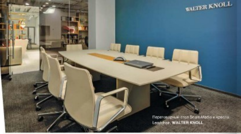
Переговорный стол Scale Media и кресла Leader, WALTER KNOLL