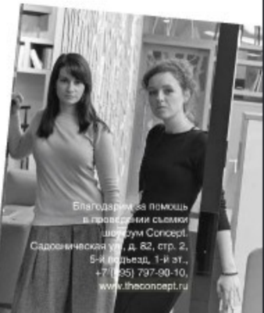
Благодарим за помощь в проведении съемки шоурум Concept, Садовническая ул., д. 82, стр. 2, 5-й подъезд, 1-й эт., +7 (895) 797-90-10, www.theconcept.ru