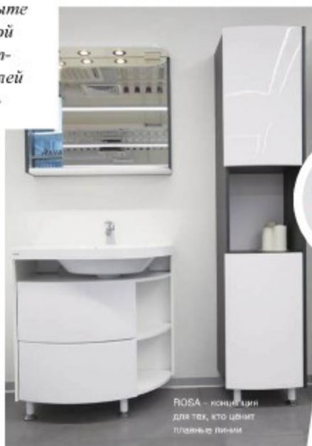
ROSA – консоль для тех, кто ценит планировку