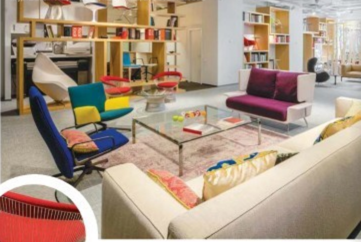
Диван Anshel и диван Associe, стулья и столы диванов Walter и Oleg, кресла Pilot, KNOLL, журнальный столик Javan, WALTER KNOLL, кресла и журнальные столики Pasha, KNOLL, лампы DOVLET HOUSE