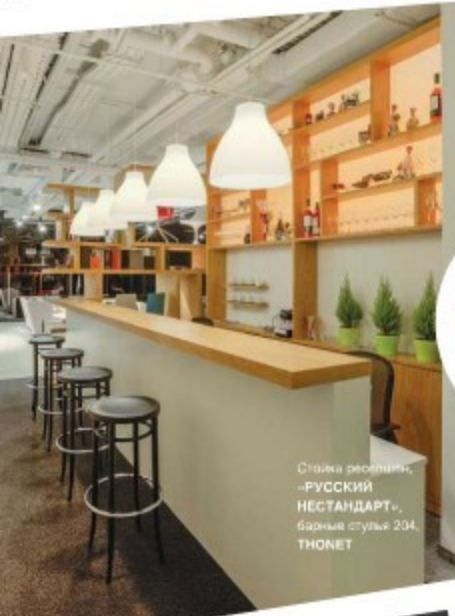
Столешня ресепшн, «РУССКИЙ НЕСТАНДАРТ», барные стулья 204, TONNET