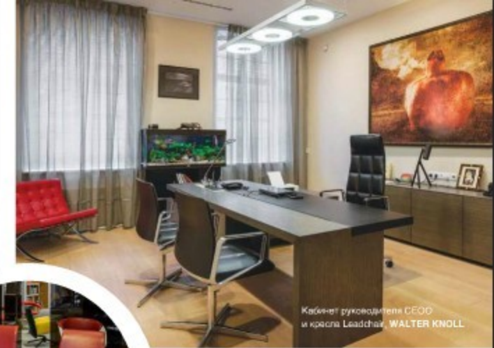
Кабинет руководителя CEO и кресла Leader, WALTER KNOLL