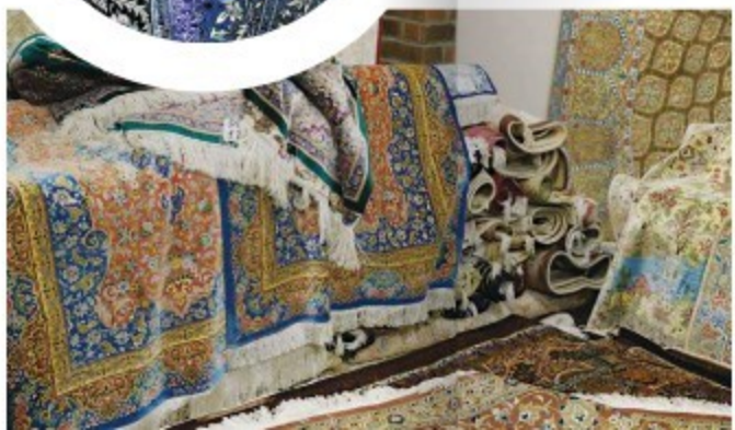
Иранский коврик Кум