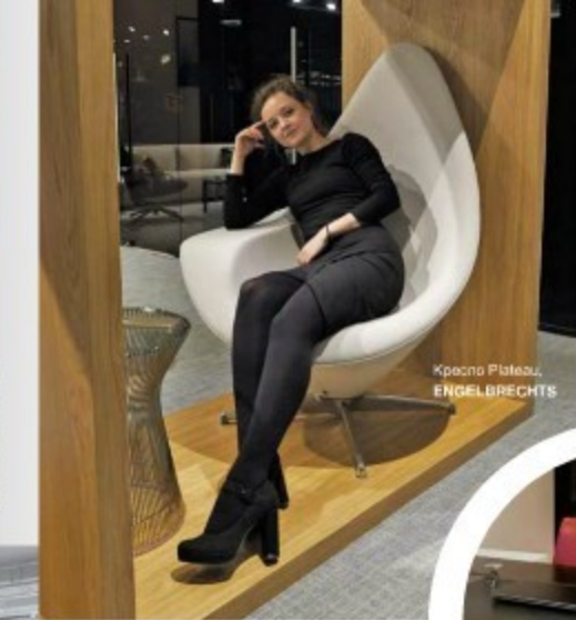
Кресло Plateau, ENGELBRECHTS