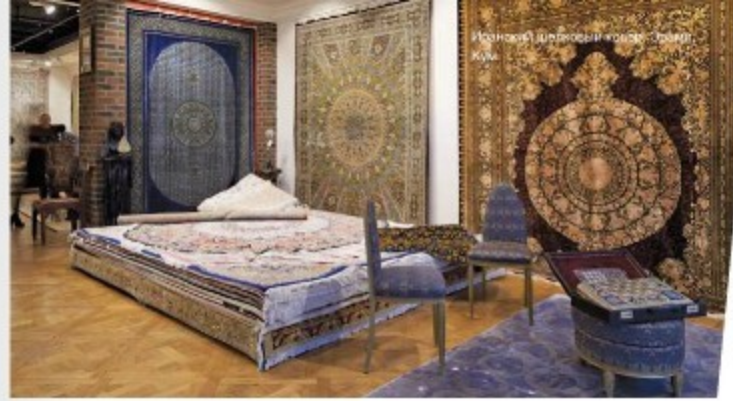
Иранский шелковый коврик Кум

Благодарим за помощь в подготовке статьи салон Iran Carpets, тел. +7 (495) 771-00-74, email: iran_carpets@mail.ru, www.iran_carpets.ru