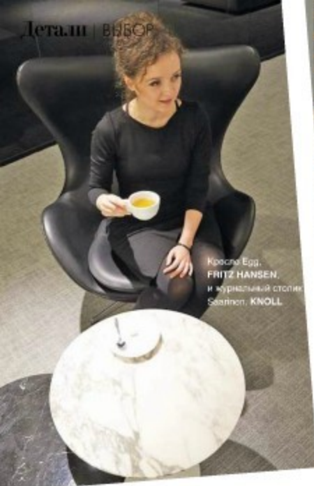
Кресло Egg, FRITZ HANSEN, и журнальный столик Seatplan, KNOLL